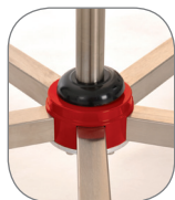
Fußgehäuse aus Vollaluminium.