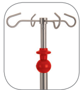
Optional: E-Hand Höhenverstellung.