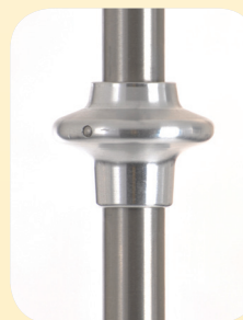
Abb. links: Einhandhöhenverstellung mit hohem Bedienkomfort, Ausführung farblos eloxiert. Best. Nr. 60115

Ohne Abb.: Fußbeschwerung 3,4 kg. Best. Nr. 60116