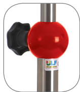
Höhenverstellung aus Vollaluminium.

Qualitativ hochwertige Rollen gewährleisten hohen Rollkomfort, vermindern Kippsituationen und damit einhergehend Stürze mit Verletzungsrisiken.